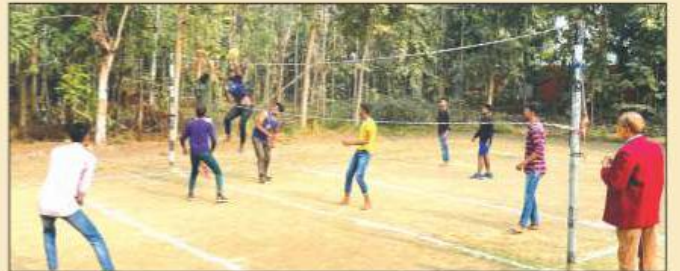
वॉलीबाल में प्रतिभाग करती महाविद्यालय की बालिका टीम (बायें) एवं बालक टीम (दायें)