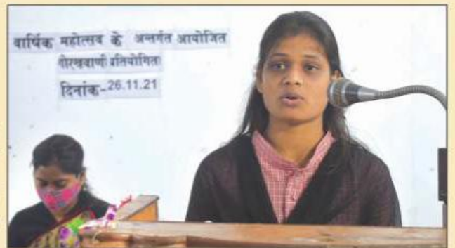
गोरखवाणी प्रतियोगिता में गुरु गोरखनाथ के रचे सबदियों का सस्वर पाठ करती छात्रा

27 नवंबर को महाराणा प्रताप महाविद्यालय, जंगल धूसड़, गोरखपुर में महाविद्यालय के वार्षिक महोत्सव के अंतर्गत गोरखवाणी प्रतियोगिता का आयोजन किया गया। प्रतियोगिता में कुल 32 विद्यार्थियों ने प्रतिभाग किया, जिसमें बी.एस-सी. तृतीय वर्ष के