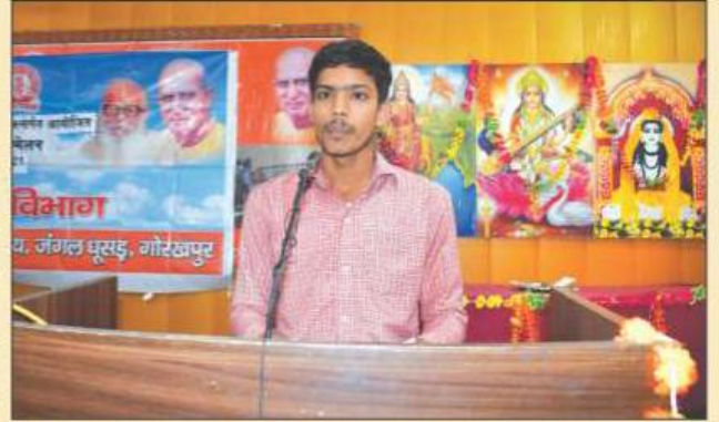
उदीयमान कवि सम्मेलन में स्वरचित कविता का पाठ करता प्रतिभागी