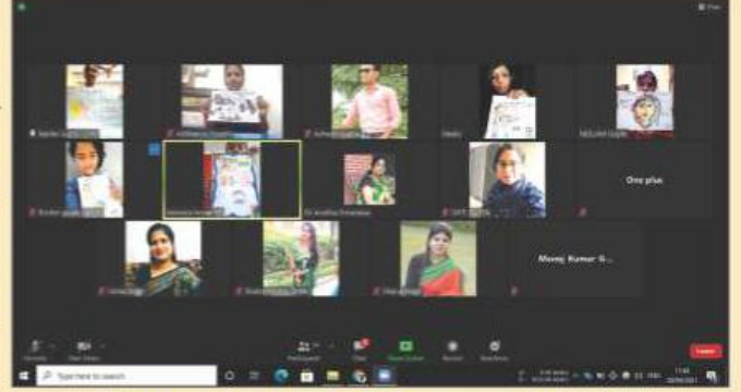
पेंटिंग प्रतियोगिता में प्रतिभाग करते विद्यार्थी