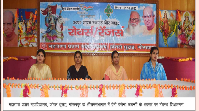
महाराणा प्रताप महाविद्यालय, जंगल धूसड़, गोरखपुर के श्रीरामसभागार में ऐनी बेसेन्ट जयन्ती के अवसर पर मंचस्थ शिक्षकगण