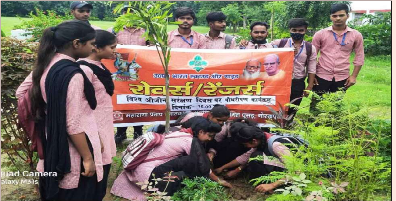
रोवर्स रेंजर्स द्वारा विश्व ओजोन संरक्षण दिवस पर पौधरोपण कार्यक्रम में पौधरोपण करते विद्यार्थी