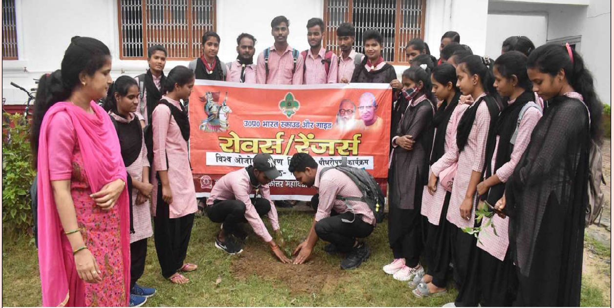
रोवर्स रेंजर्स द्वारा विश्व ओजोन संरक्षण दिवस पर पौधरोपण कार्यक्रम में पौधरोपण करते विद्यार्थी