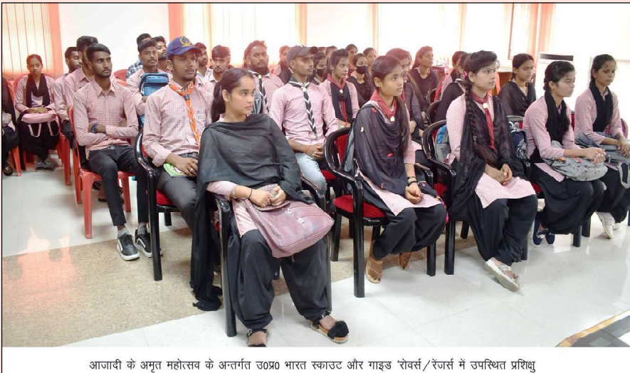
आजादी के अमृत महोत्सव के अन्तर्गत 30 प्र० भारत स्कूट और गाइड 'रोवर्स/रेंजर्स' में उपस्थित प्रशिक्षु