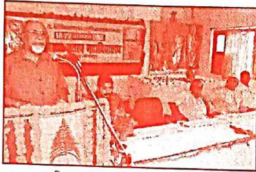
स्मृति व्याख्यान-माला का उद्घाटन समारोह