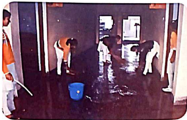
श्रमदान करती छात्राएं