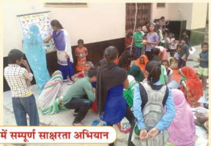
सांसद आदर्श गाँव डाँगीपार में सम्पूर्ण साक्षरता अभियान