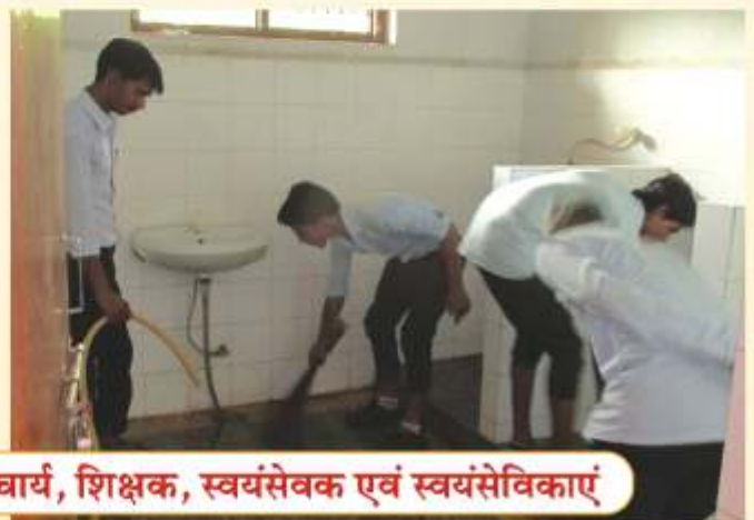
साप्ताहिक स्वैच्छिक श्रमदान कार्यक्रम में प्राचार्य, शिक्षक, स्वयंसेवक एवं स्वयंसेविकाएं