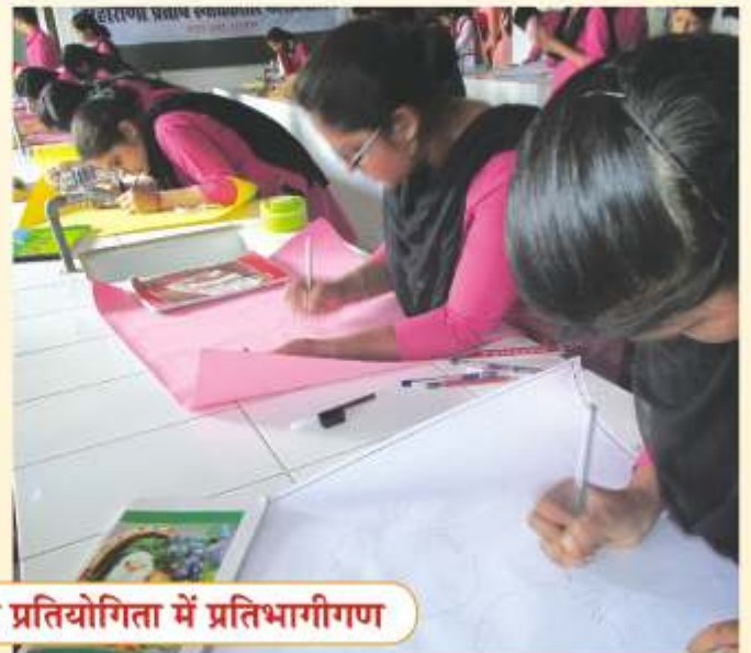
पर्यावरण संरक्षण पर पोस्टर प्रतियोगिता में प्रतिभागीगण