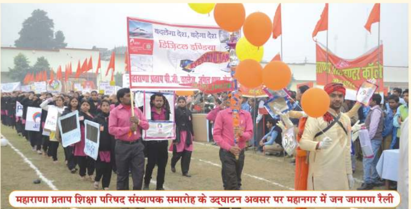
महाराणा प्रताप शिक्षा परिषद संस्थापक समारोह के उद्घाटन अवसर पर महानगर में जन जागरण रैली