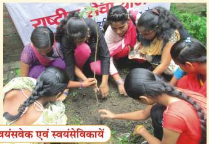
पौधरोपण करते शिक्षक, स्वयंसवेक एवं स्वयंसेविकायें