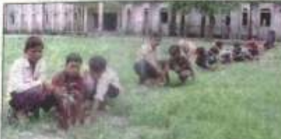
पौधरोपण करते राजकीय अध्यात्म पद्धति विद्यालय के छात्र।