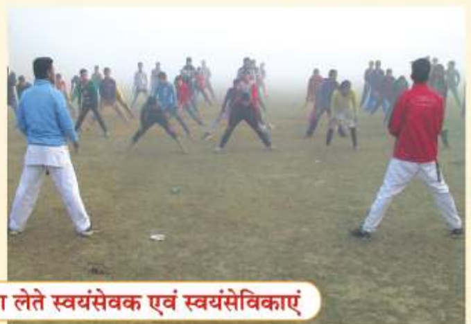
सायं सत्र में ताइक्वांडों का प्रशिक्षण लेते स्वयंसेवक एवं स्वयंसेविकाएं