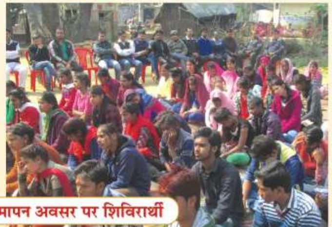
सात दिवसीय शिविर के समापन अवसर पर शिविरार्थी