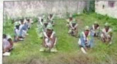
पौधरोपण करते विज्ञान इंटर कालेज की छात्राएं।