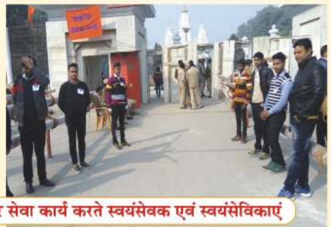
गोरखनाथ मंदिर में मकर संक्रांति के अवसर पर सेवा कार्य करते स्वयंसेवक एवं स्वयंसेविकाएं