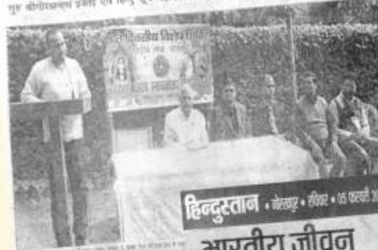
प्रताप इकाई के संयुक्त तत्वावधान में राष्ट्रीय सेवा शिविर के तीसरे बौद्धिक सत्र में स्वयं सेवकों एवं