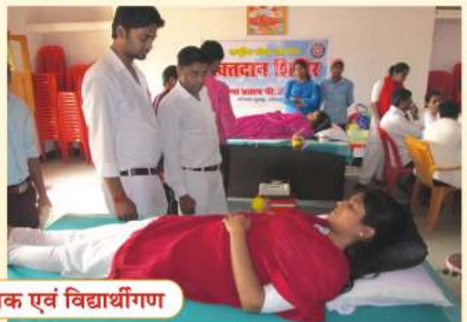
रक्तदान करते शिक्षक एवं विद्यार्थीगण