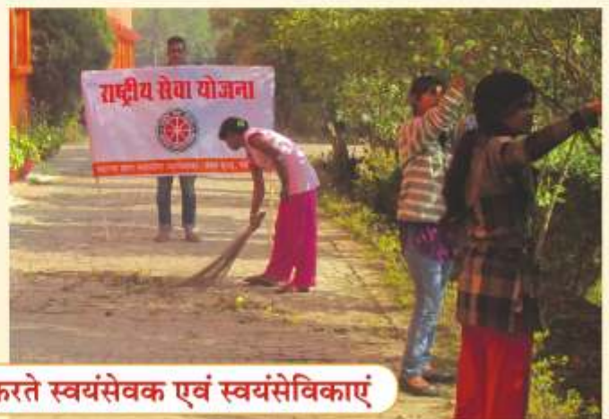
सात दिवसीय शिविर में श्रमदान करते स्वयंसेवक एवं स्वयंसेविकाएं