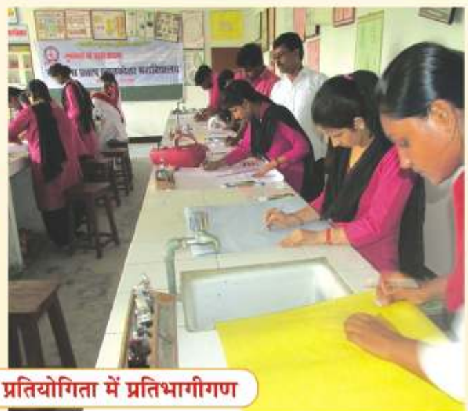
पर्यावरण संरक्षण पर पोस्टर प्रतियोगिता में प्रतिभागीगण