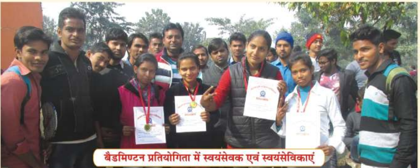
बैडमिण्टन प्रतियोगिता में स्वयंसेवक एवं स्वयंसेविकाएं