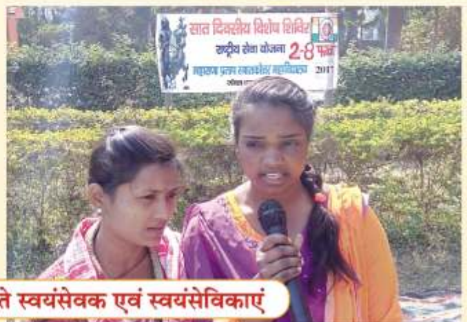
सांस्कृतिक कार्यक्रम प्रस्तुत करते स्वयंसेवक एवं स्वयंसेविकाएं