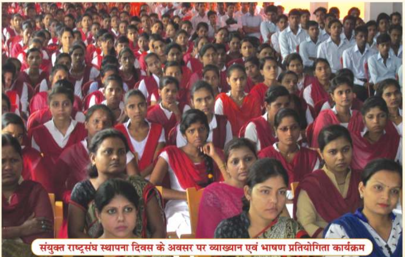
संयुक्त राष्ट्रसंघ स्थापना दिवस के अवसर पर व्याख्यान एवं भाषण प्रतियोगिता कार्यक्रम