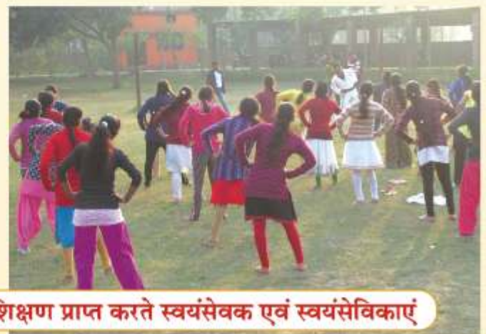
सात दिवसीय शिविर में जूडो एवं कराटे का प्रशिक्षण प्राप्त करते स्वयंसेवक एवं स्वयंसेविकाएं