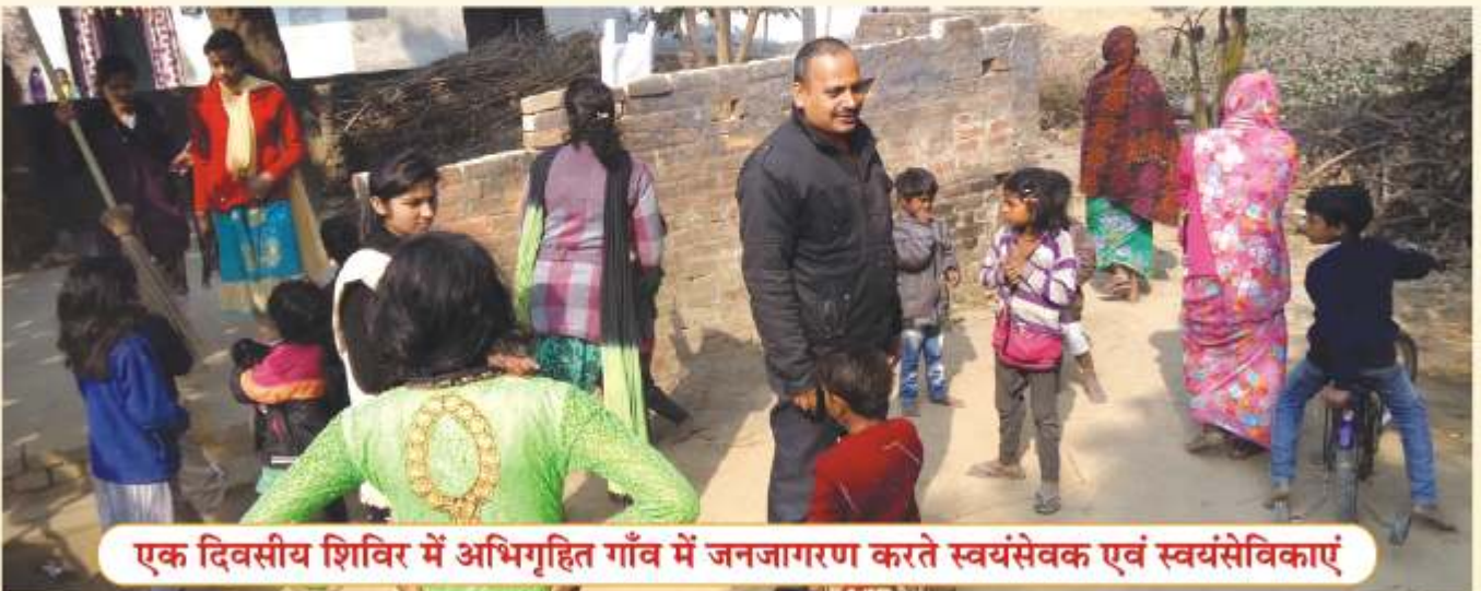
एक दिवसीय शिविर में अभिगृहित गाँव में जनजागरण करते स्वयंसेवक एवं स्वयंसेविकाएं