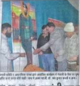
नेताजी सुभाष चंद्र बोस की जयन्ती पर गोरखपुर में आयोजित कार्यक्रम में भाग ले रहे हैं।

नेताजी सुभाष चंद्र बोस ने आजाद हिन्द फौज के संस्थापक के रूप में सुभाषीयों में आजादी का जोश भरने में अग्रणी भूमिका निभाई थी। उन युवाओं को जो नेताजी के आदर्शों से प्रभावित हुए, वे ही आजाद हिन्द फौज के संस्थापक बने। नेताजी सुभाष चंद्र बोस ने आजाद हिन्द फौज के संस्थापकों को प्रेरणा दी थी।