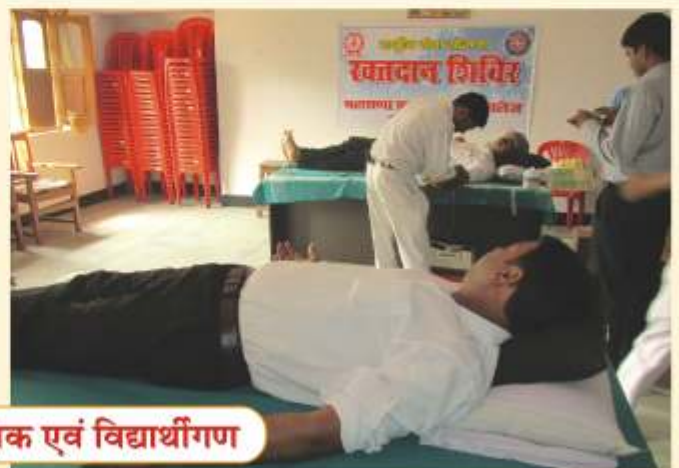
रक्तदान करते शिक्षक एवं विद्यार्थीगण