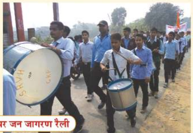
विश्व एड्स दिवस पर जन जागरण रैली