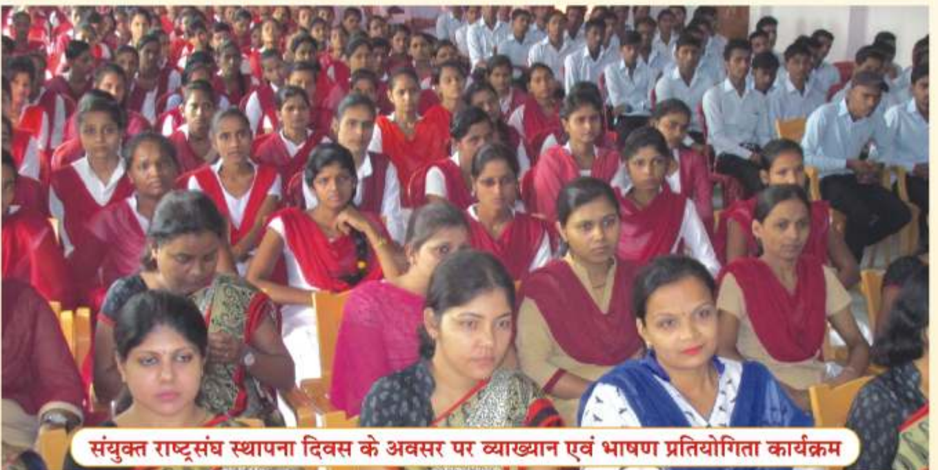
संयुक्त राष्ट्रसंघ स्थापना दिवस के अवसर पर व्याख्यान एवं भाषण प्रतियोगिता कार्यक्रम