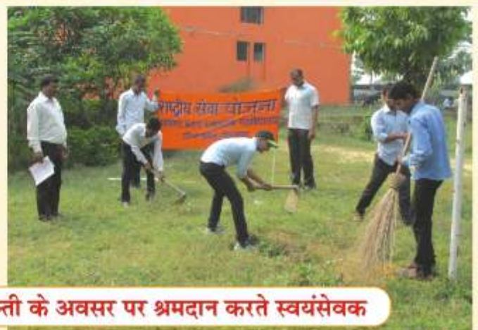
महात्मा गाँधी एवं लाल बहादुर शास्त्री जयन्ती के अवसर पर श्रमदान करते स्वयंसेवक