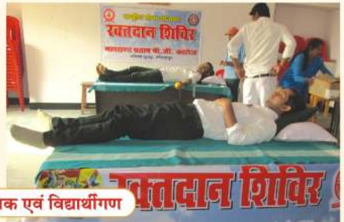
रक्तदान करते शिक्षक एवं विद्यार्थीगण