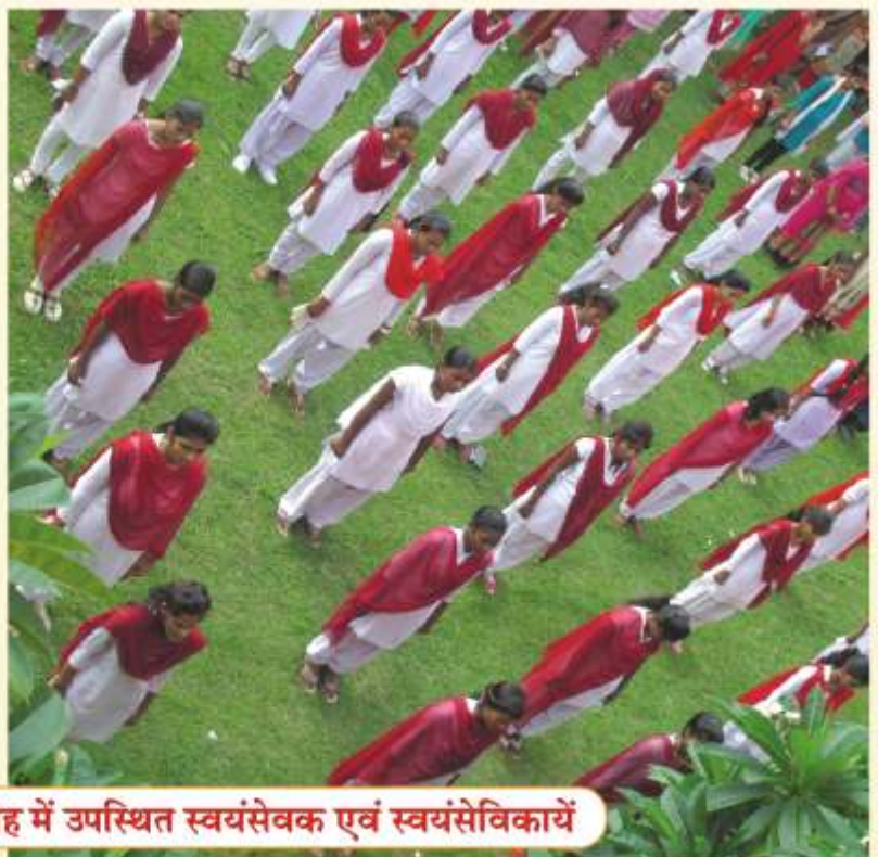
स्वतंत्रता दिवस समारोह में उपस्थित स्वयंसेवक एवं स्वयंसेविकायें