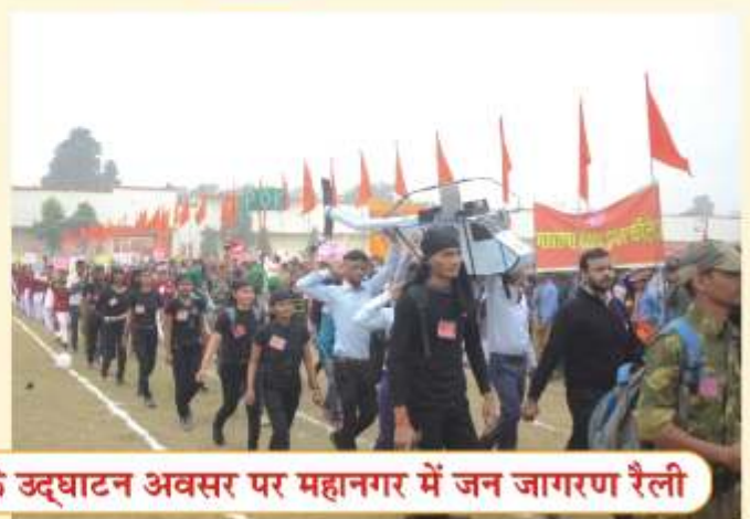
महाराणा प्रताप शिक्षा परिषद संस्थापक समारोह के उद्घाटन अवसर पर महानगर में जन जागरण रैली