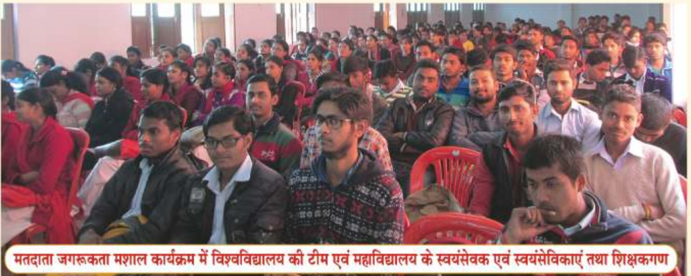
मतदाता जगरूकता मशाल कार्यक्रम में विश्वविद्यालय की टीम एवं महाविद्यालय के स्वयंसेवक एवं स्वयंसेविकाएं तथा शिक्षकगण