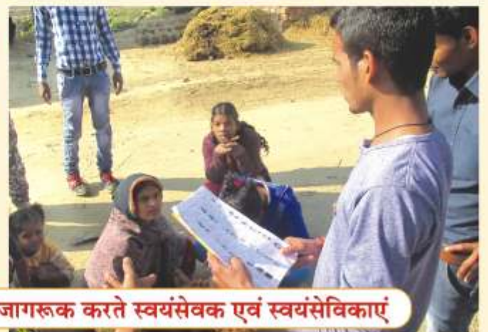
विशेष शिविर में मतदान हेतु घर-घर जाकर जागरूक करते स्वयंसेवक एवं स्वयंसेविकाएं