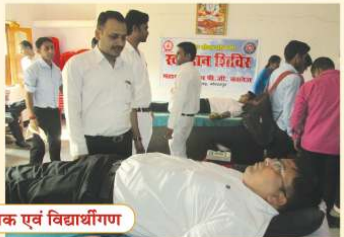
रक्तदान करते शिक्षक एवं विद्यार्थीगण