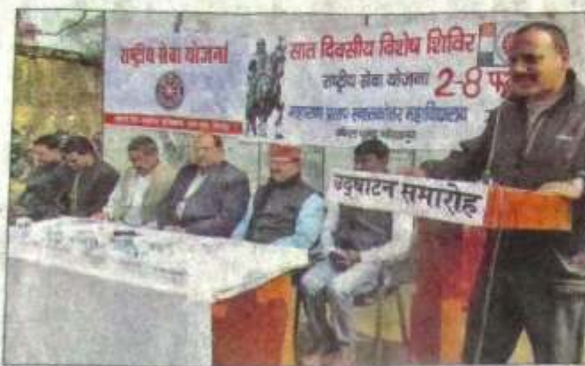
गुरुवार को एमपीएस महाविद्यालय जंगल धूसड़ में राष्ट्रीय सेवा योजना के तहत सात दिवसीय विशेष शिविर में मौजूद छात्रों को सम्बोधित करते शिक्षक व मंचासीन अतिथि।