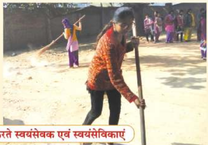
एकदिवसीय शिविर में श्रमदान करते स्वयंसेवक एवं स्वयंसेविकाएं