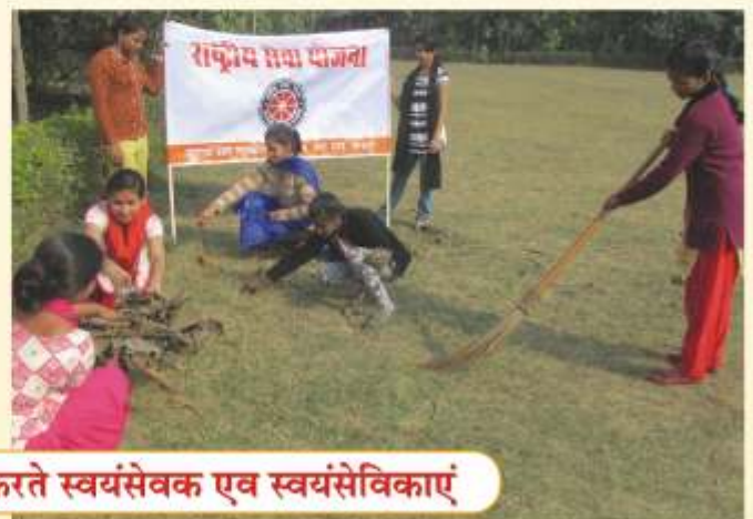
शिविर में श्रमदान एवं प्राणायाम करते स्वयंसेवक एवं स्वयंसेविकाएं