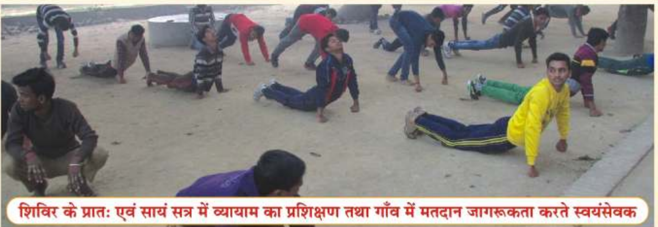
शिविर के प्रातः एवं सायं सत्र में व्यायाम का प्रशिक्षण तथा गाँव में मतदान जागरूकता करते स्वयंसेवक