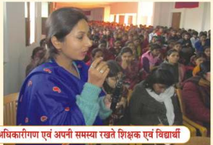
डिजिटल बैंकिंग का प्रशिक्षण देते भारतीय स्टेट बैंक के अधिकारीगण एवं अपनी समस्या रखते शिक्षक एवं विद्यार्थी