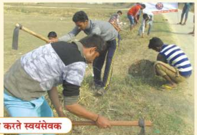
शिविर में श्रमदान करते स्वयंसेवक