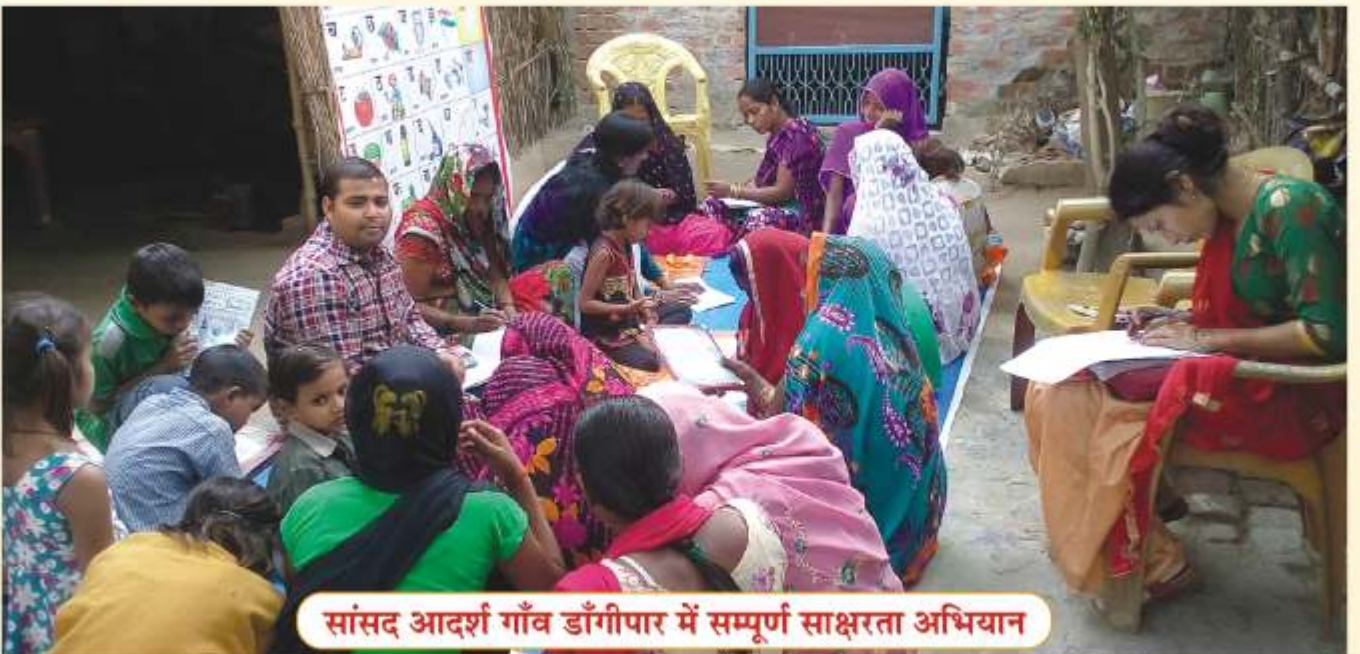
सांसद आदर्श गाँव डाँगीपार में सम्पूर्ण साक्षरता अभियान