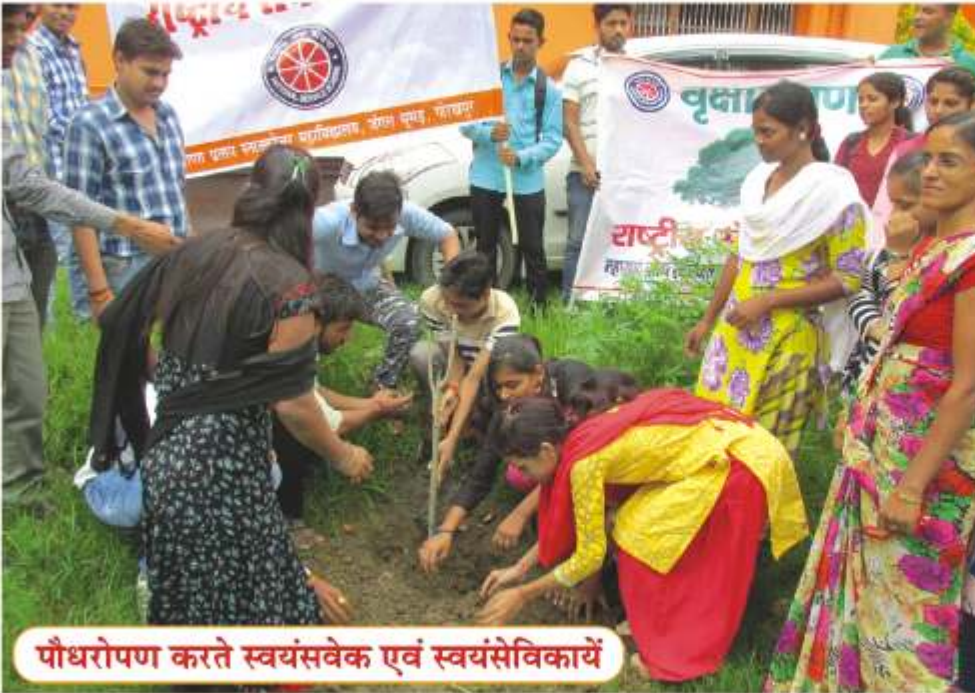
पौधरोपण करते स्वयंसंवेक एवं स्वयंसेविकायें