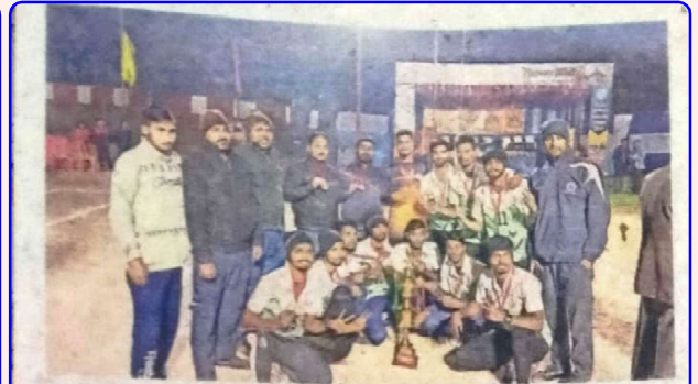
ट्राफी व मेडल के साथ गोरखपुर विश्वविद्यालय की कांस्य पदक टीम • जामरग